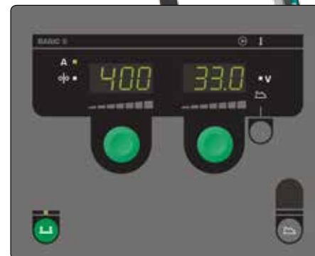
Panel sterowania Basic do ręcznego ustawiania parametrów spawania.

PowerArc™ zapewnia pełny przetop przy spawaniu pachwinowym i doczołowym oraz większą prędkość spawania dla stali miękkich i nierdzewnych.