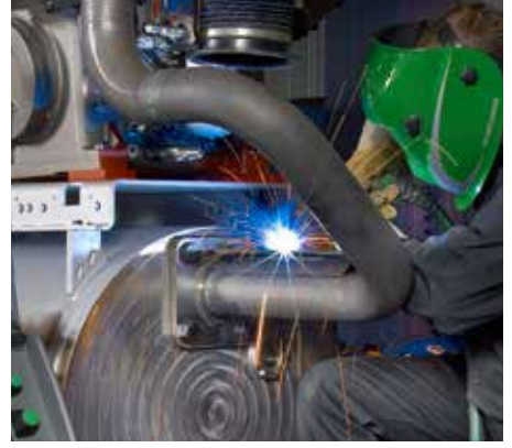
Spawanie stali miękkiej.